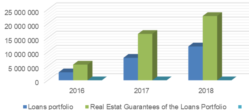
Loans Portfolios Real Estate Guarantees